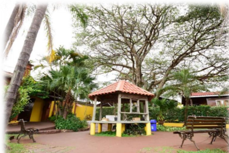
COLÉGIO LACORDAIRE UM MUNDO DE CONHECIMENTO

A seguir foram destacadas algumas ações promovidas pelo Colégio Prof. Lacordaire que objetivam aplicar os valores que a Escola acredita, com Campanhas, Projetos em que os alunos, pais e toda a comunidade se envolveram: